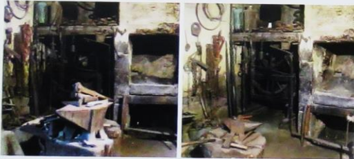
03 Bottega del fabbro/Kovacija Masseris/Mašera