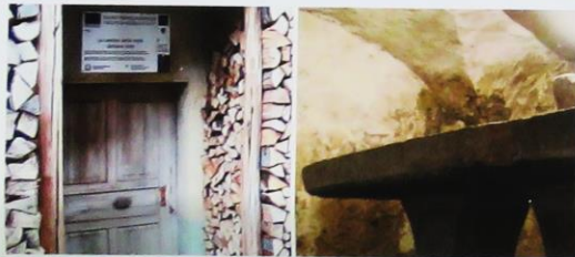
04 La cantina delle volte/Uelbana kliet Masseris/Mašera