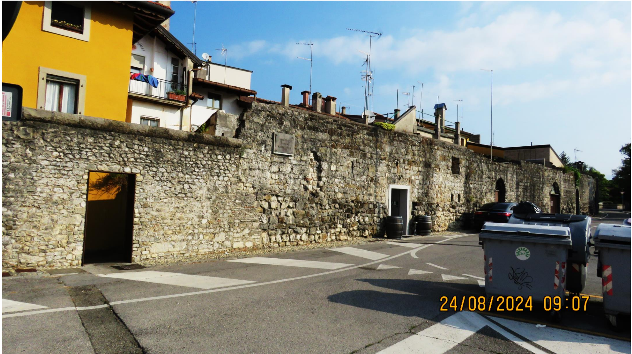
Mestno obzidje Čedadada.