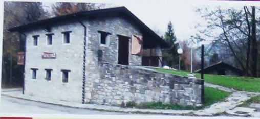
01 Collezione Rastrelli/Zbirka Grablje Vartacia/Vartača