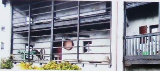
02 Museo del Matajur/Muzej Matajura Masseris/Mašera